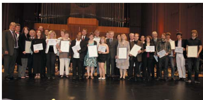
Preisträger "musik gewinnt" 2010