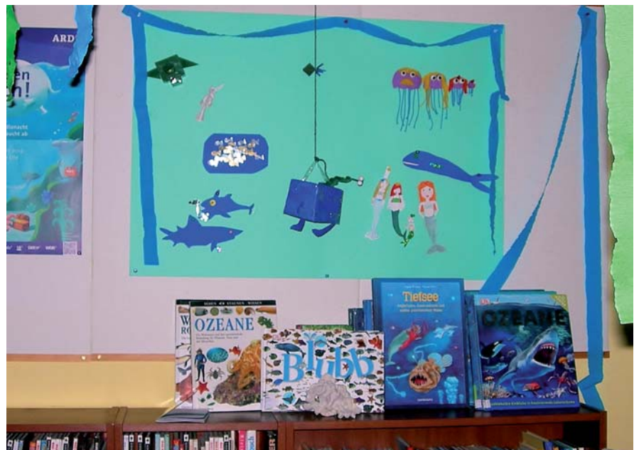
Von den Kindern gestaltetes Plakat zum Hörspiel: „Die 'NGS Ohrenschmaus' auf Tauchfahrt“

Inzwischen gehört die AG Ohrenschmaus zum festen Bestandteil des Schullebens. Sie ist auch in das Medienkonzept dieser Montessori-orientierten Grundschule eingebunden und will Kinder dazu befähigen, kompetent mit tradierten und neuen Medien umzugehen. Einmal in der Woche treffen sich Mädchen und Jungen der Klassen 4 bis 6 für 90 Minuten in der Schulbibliothek und lassen sich zusammen mit Hans-Ulrich Pollack, dem langjährigen Leiter der Bücherei, auf immer wieder neuen Hörspaß ein. Der besteht in folgendem Dreiklang: Gemeinsam werden mit dem AUDITORIX -Hörbuchsiegel besiegel-