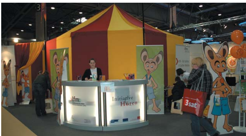
Der AUDITORIX Gemeinschaftsstand auf der Leipziger Buchmesse 2011