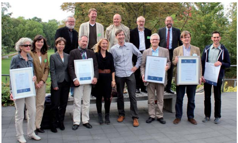
Jurymitglieder des VDS Medienpreises und Preisträger 2012.

In der Regel werden drei bis vier Medienpreise vergeben und etwa ebenso viele Empfehlungen ausgesprochen. Beide Gruppierungen