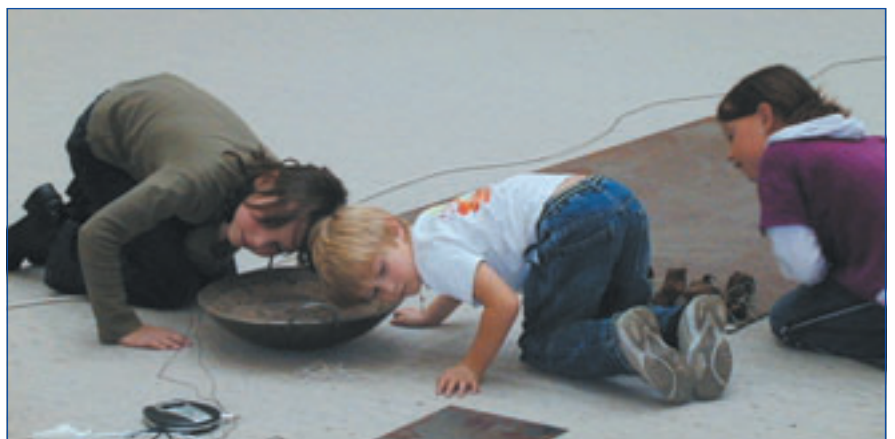
Bochumer Museum: Kinder in Aktion