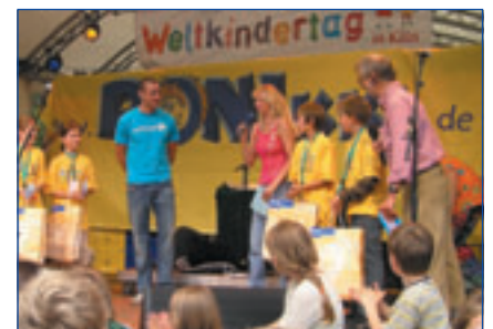
Radio108,8-Kinder mit Nationalspieler Christoph Metzelder auf der LILIPUZ-Bühne