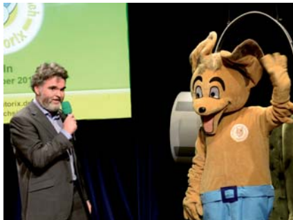
Jörg Lengersdorf mit AUDITORIX.

Am 17. Oktober 2014 wurden im Rahmen einer Preisverleihung die diesjährigen AUDITORIX-Hörbuchsiegel im Kleinen Sendesaal des WDR-Funkhauses bereits zum sechsten Mal vergeben. Der Moderator des Abends, Jörg Lengersdorf, schwärmte in seiner Anmoderation, dass seine Tochter beim Anblick des mit den wunderbaren Kinderhörbuchproduktionen gefüllten Bücherschranks für Tage, Wochen, wenn nicht Monate abtauchen und nichts anderes tun würde, als diese zu genießen.