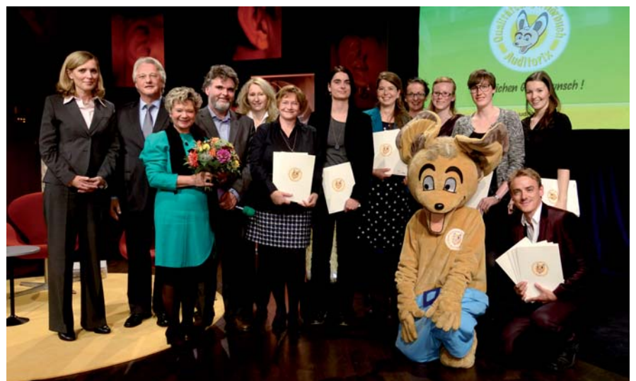
Die Preisträger und Träger des AUDITORIX-Hörbuchsiegels 2014.