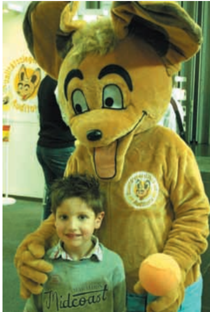
AUDITORIX – der Liebling der Kinder