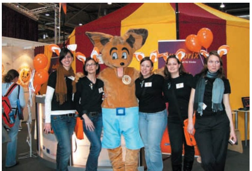
AUDITORIX-Standteam LeipzigerBuchmesse 2010