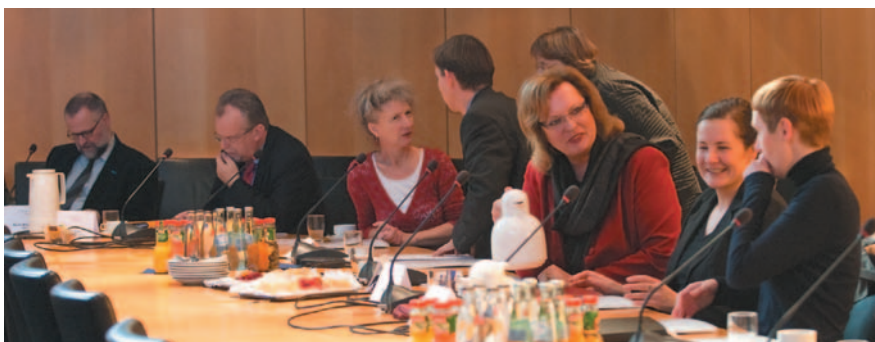
Delegierte auf der Jahresversammlung 2009