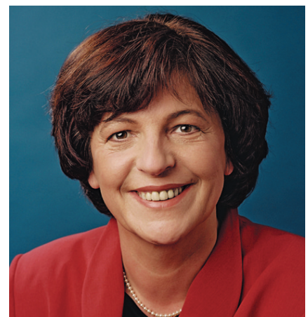
Gesundheitsministerin Ulla Schmidt