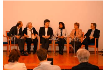
Kulturpolitisches Forum WDR 3