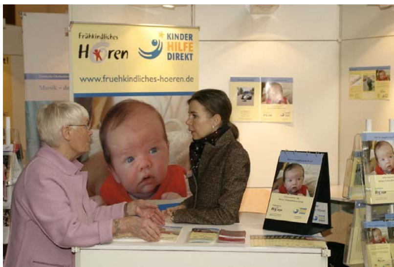
Informationsstand „Frühkindliches Hören“