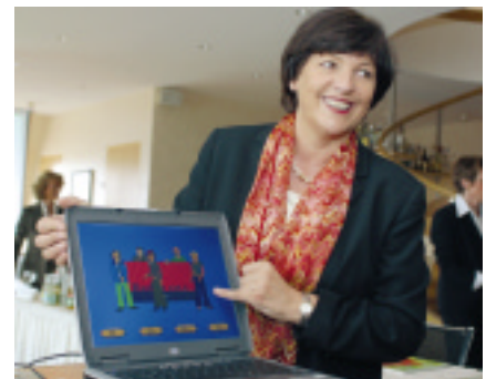
Bundessozialministerin Ulla Schmidt am 19.03. in Köln

„Projektkreis Schule des Hörens e.V.“ entwickelte Computerspiel wird von der „Initiative Hören e.V.“ unterstützt, deren Botschafterin Ulla Schmidt ist. Eingebettet in das Tagesgeschäft eines Radiosenders lernen Kinder im Alter zwischen 10 und 12 Jahren beim „Radio 108,8“ zum Beispiel den Aufbau und die faszinierende Funktionsweise des Ohrs mit dessen besonderer Schutzbedürftigkeit kennen.