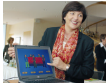
Bundessozialministerin Ulla Schmidt am 19.03. in Köln

„Projektkreis Schule des Hörens e.V.“ entwickelte Computerspiel wird von der „Initiative Hören e.V.“ unterstützt, deren Botschafterin Ulla Schmidt ist. Eingebettet in das Tagesgeschäft eines Radiosenders lernen Kinder im Alter zwischen 10 und 12 Jahren beim „Radio 108,8“ zum Beispiel den Aufbau und die faszinierende Funktionsweise des Ohrs mit dessen besonderer Schutzbedürftigkeit kennen.